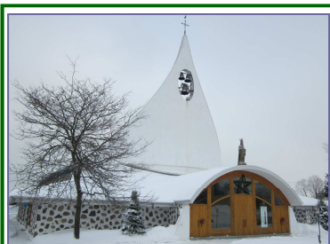
Saint Nicolas Église construite en 1962