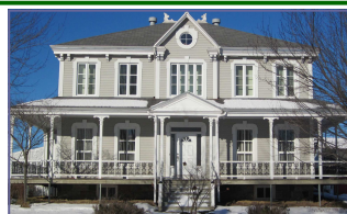
Communauté de Saint-Étienne-de-Lauzon

Heures d'accueil: 9 h 30 à 12 h 13 h 30 à 15 h 30