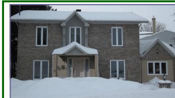
Communauté du Très-Saint-Rédempteur

Heures d'accueil: 9 h 30 à 12 h 13 h 30 à 15 h 30