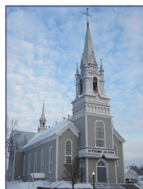
Saint-Étienne-de-Lauzon Église construite en 1904

Messes dominicales: Samedi 16 h 30 Dimanche 10 h 30