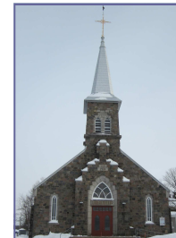
Très-Saint-Rédempteur Église construite en 1938

Messes dominicales: Dimanche 9 h et 11 h