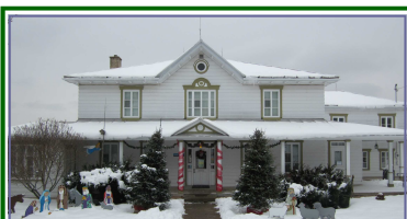
Communauté de Saint Nicolas

1450, rue des Pionniers Saint-Nicolas G7A 4L6 Téléphone: 418-831-9622 Télécopieur: 418-836-8077 Courriel: info@sndl.org